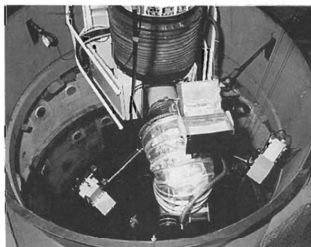
写真1. 水 ジ ェ ッ ト ノ ズ ル

その他、ダンプコンデンサー建屋では、排ガス処理室内の機器(サンプリングラック、配管、ケーブル等)の撤去が進行中であります。